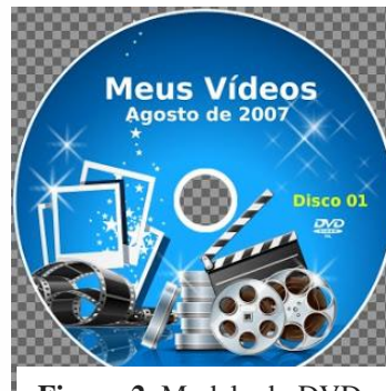
Figura 2: Modelo do DVD