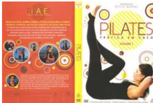
Figura 1: Modelo de Capa e Verso da capa.