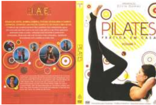
Figura 1: Modelo de Capa e Verso da capa.