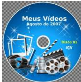
Figura 2: Modelo do DVD