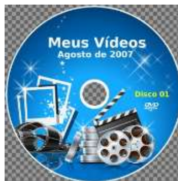
Figura 2: Modelo do DVD