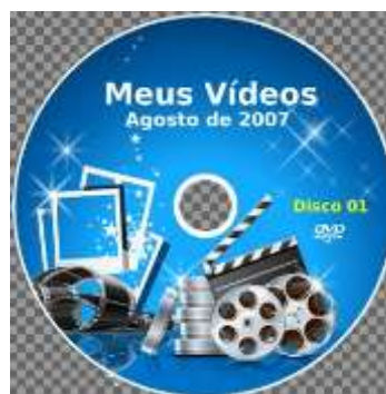
Figura 2: Modelo do DVD