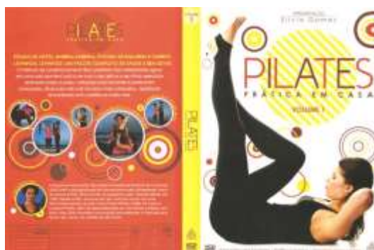
Figura 1: Modelo de Capa e Verso da capa.